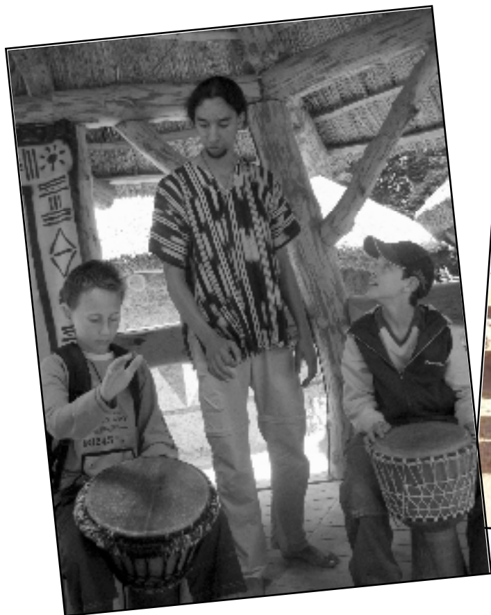
O africkém umění v jihlavské ZOO