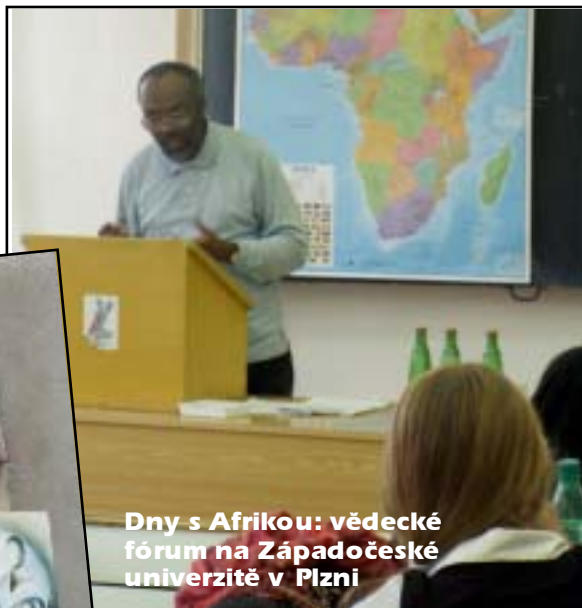
Dny s Afrikou: vědecké fórum na Západočeské univerzitě v Plzni