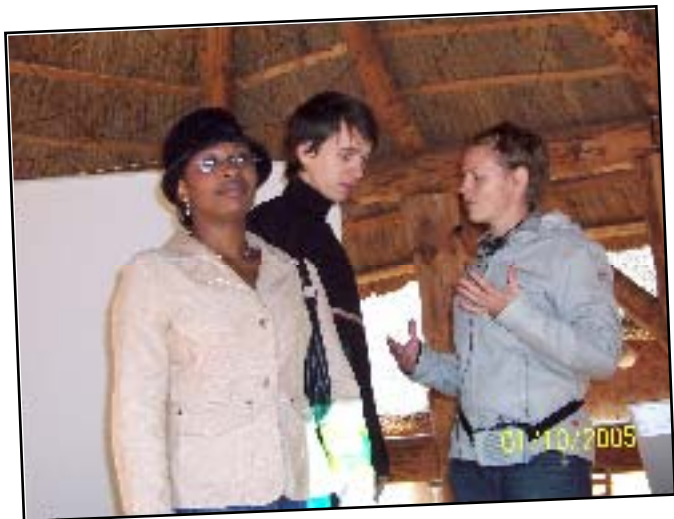
Multikulti v Jihlavské ZOO