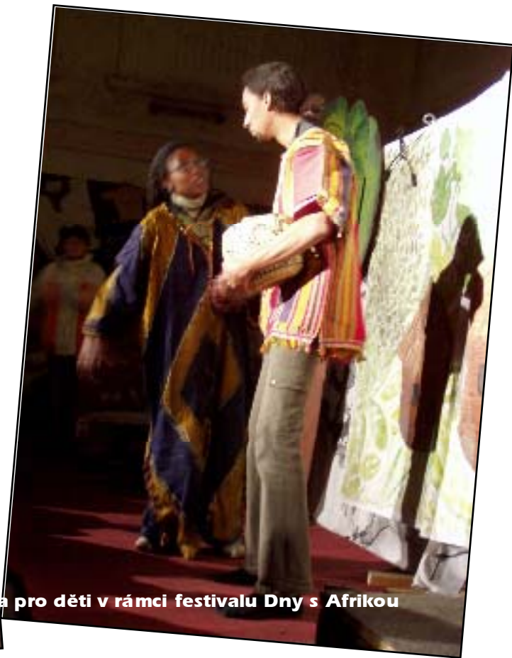
Pohádka pro děti v rámci festivalu Dny s Afrikou