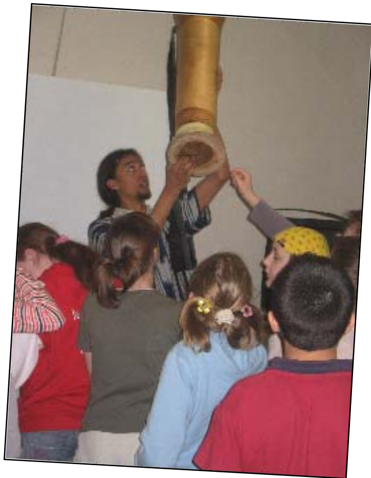
Multikulti v Kuřimi u Brna