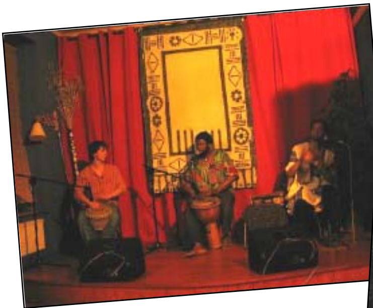
TukuTiko v kavárně Jabloň