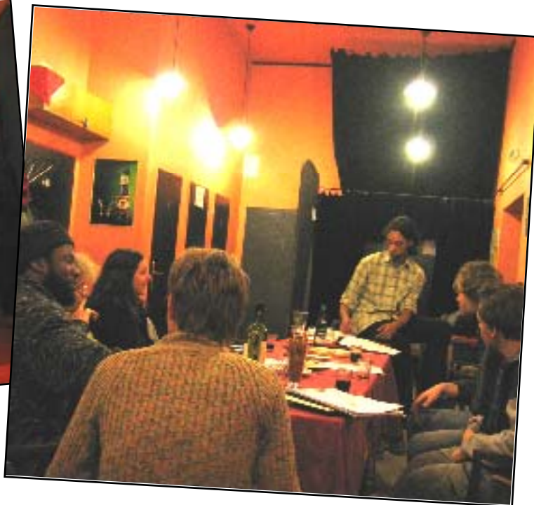
1. Valná hromada